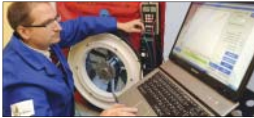
Energetische Beratung und Baubegleitung sind über die KfW förderfähig.

Zur Planung einer energetischen Sanierung sollte unbedingt ein erfahrener und anerkannter Energieberater hinzugezogen werden, rät der Bauherren-Schutzbund. Er plant nicht nur die Maßnah-