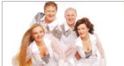
Absolut Abba lassen die Hits der Schweden aufleben.

Mit seinem Hit „Ich will Spaß“ stürmte Markus im Sommer 1982 auf Platz eins der deutschen Charts. Unzäh-