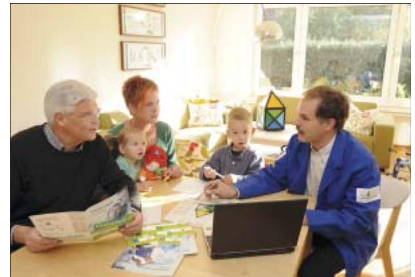
Zu einer Hausmodernisierung gehört eine gründliche Energieberatung durch einen unabhängigen Bauherrenberater.

Außerdem werden seit September Einzelmaßnahmen zur energieeffizienten Sanierung zwar nicht mehr durch die KfW gefördert, dafür werden aber mit dem Programm „Wohnraum Moder-