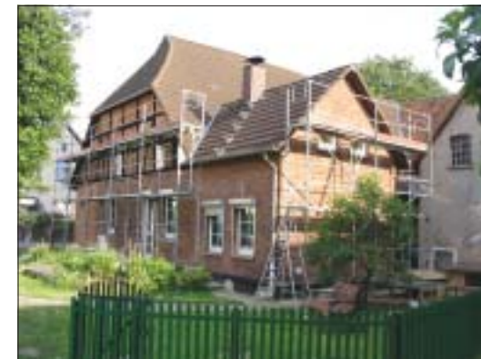
Die Sanierung eines Altbaus lohnt sich nach wie vor. Auch verschiedene Förderprogramme gibt es noch.

Alternativ zum Programm „Wohnraum Modernisieren“ kann für den altersgerechten Umbau eines Hauses oder Eigentumswohnung auch ein Zuschuss der KfW in Anspruch genommen werden. Der Zuschuss beträgt bei Investitionen ab 6.000 Euro fünf Prozent der Investitionskosten, maximal aber 2.500 Euro.