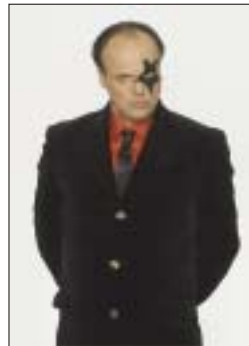
Nach wie vor eine schillernde Persönlichkeit: Hubert Kah.

lige Auftritte folgten und der Künstler wurde schnell zum Kronprinzen der NDW ernannt. Unvergessen sein Kinofilm „Ich geb' Gas – ich will Spaß“ mit Filmpartnerin Nena und dem gemeinsamen Duett „Kleine Taschenlampe brenn“, das als eines der schönsten Liebeslieder der NDW in die Geschichte einging.